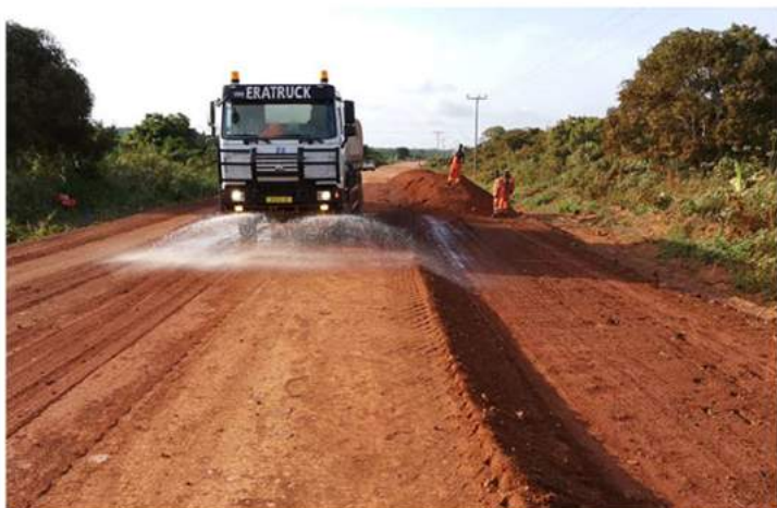
Réhabilitation de la route de desserte Akontonbra – Alikra 28km GHANA