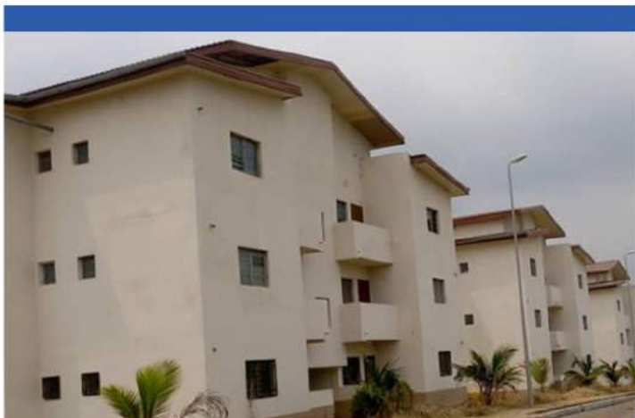
Construction et Approvisionnement en eau potable de 800 logements de type F3 BURKINA FASO