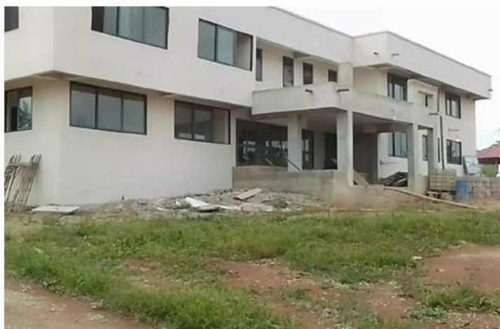
Construction et achèvement d'un bloc administratif de 2 étages pour les bureaux du Département de la Décentralisation GHANA