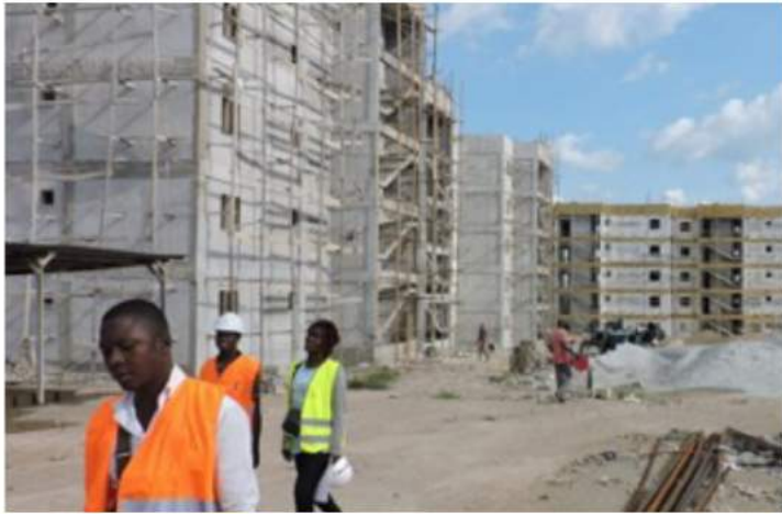
Construction et Approvisionnement en eau potable de 950 logements de type F4 CÔTE D'IVOIRE