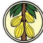
Ghana Cocoa Board Poised to Maintain Premium Quality Cocoa