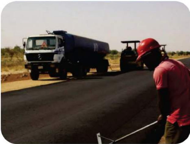
Travaux de Construction de route Ghana