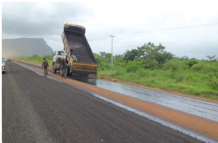
Travaux d'aménagement et de bitumage de 35 km de route dans la Province du NAYALA, BURKINA FASO