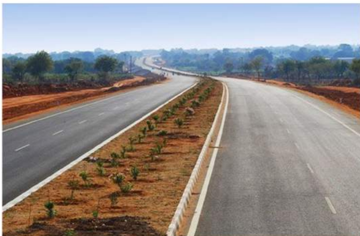
Aménagement et Bitumage de 50 km de route dans les Cercles de BAFOULABE, KITA et KENIEBA MALI