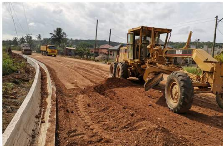
Réhabilitation Route de desserte Kabiesue Jn – Kabiesue 25,20km GHANA