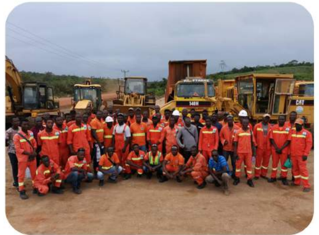
Equipe COPIAFAX Ghana sur un site de Construction au Ghana