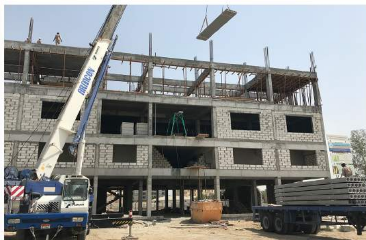
Construction des projets d'infrastructures sanitaires prioritaires du Gouvernement - Agenda 111_ Manso Adubia GHANA