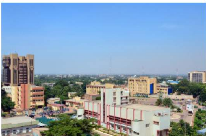
Construction d'un Centre d'Opérations à l'Aéroport International de Ouagadougou BURKINA FASO