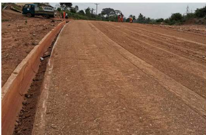
Bitumage de la route ASSUOM – LARBIKROM longue de 35 km au GHANA