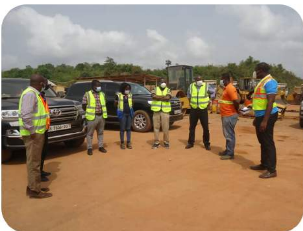
Nos Superviseurs sur un site de Construction au Ghana