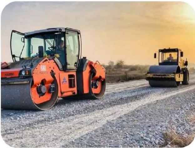
Travaux de Construction de route Ghana