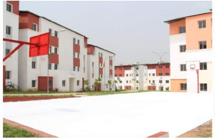
Construction et Approvisionnement en eau potable de 950 logements de type F4 SENEGAL