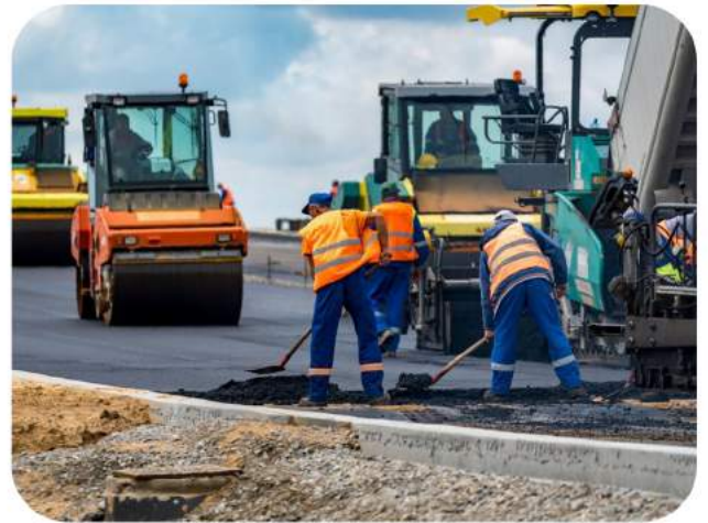
Travaux de Construction de route Ghana